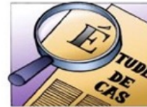
Etudes de cas en IEF