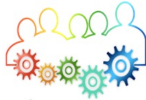
Échanges de pratiques