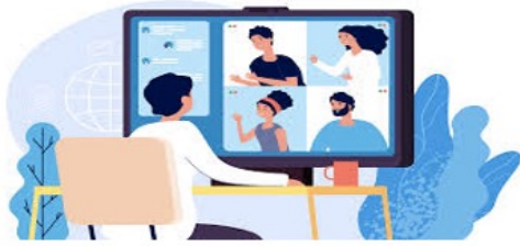
Exposés & visioconférences